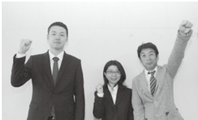
▲江府町のまちおこし、頑張ります！

4月から新たに3名の地域おこし協力隊が着任しました。昨年度着任した6名とあわせ、計9名で江府町のまちづくりの一翼を担います。