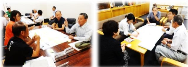
それぞれのグループで繰り広げられる白熱した議論

江府町では現在「集落総合点検」を行い、各集落のよさや課題、将来像について住民のみなさんに考えていただいています。その学校版が今回のCS委員会のテーマです。