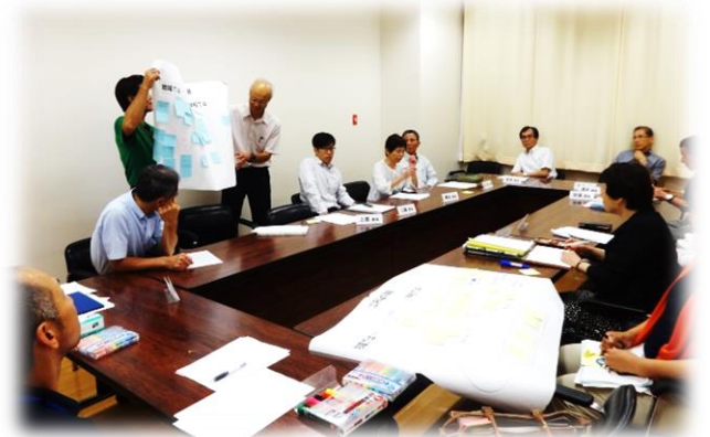
それぞれのグループで出た意見を全体で共有