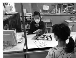
▲本の貸出しの様子

4月よりコミュニティ図書館支援員として活動しております。主に、防災・情報センターにある町立図書館に勤務しています。図書館の前は通学バスの発着場になっていて、毎日たくさんの小学生がやってきます。読んだ本の感想など子どもたちの話を聞いたり、所蔵図書を見て一緒に工作したり、毎日楽しいです。