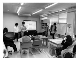
▲春休み体験入塾の様子

3月24日から4月2日まで、まなびや縁側を体験できる「春休み体験入塾」を開催しました。個別学習指導から東京大学生による特別講座も実施し、参加生徒たちから「また、まなびや縁側に来たいです」等の感想をいただきとても嬉しく思っています。来月の定期テストで、生徒たちが良い結果を残せるように、サポートをしていきたいです。