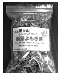
▲新芽よもぎ茶の試供品

秋から育てているカモミールを剪定していますが、僅かに蕾を付けてきました。追加で春に播種したのも育苗していますが、秋播種の時のように早く芽が出てきません。保温室が欲しいところですね。代わりによもぎがいち早く育ってきたので、新芽をお茶にして、試供品として親しい方たちに飲んでもらっていますが、意外と好評です。