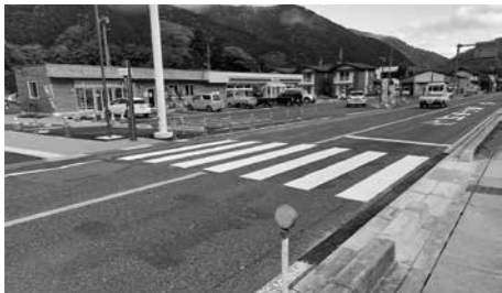
佐川第2団地付近の横断歩道

人口減少に歯止めをかけるため、整備した地域優良賃貸住宅（佐川第2団地）が、令和6年1月から入居を開始し、3月で満室になっていく。町外からの移住者は12名。そのうち子どもの人数は5名で、町外からの入居数は、全12戸のうち7戸である。人口流出を防ぎ、町外からの人口流入を促進させた。今後においても、入居者からの利