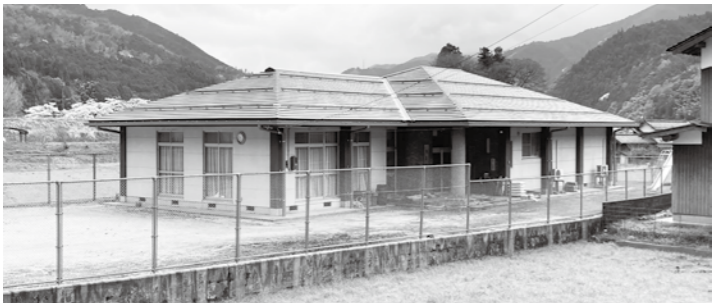
屋根の改修が終わった武庫集会所

産業建設課業務以外についても災害時の対応力向上のため、訓練を定期的に実施したい。