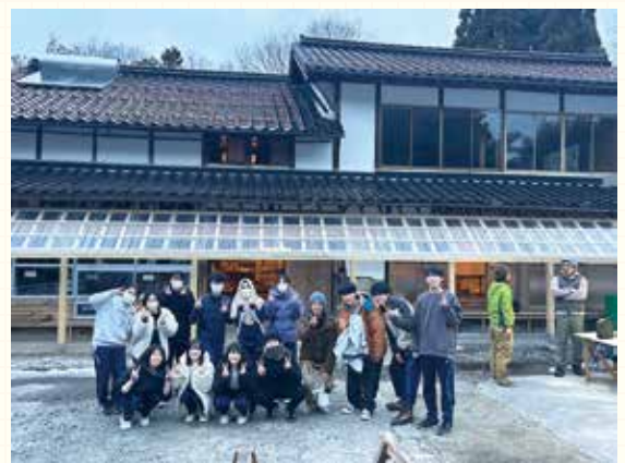
西成公民館前の古民家