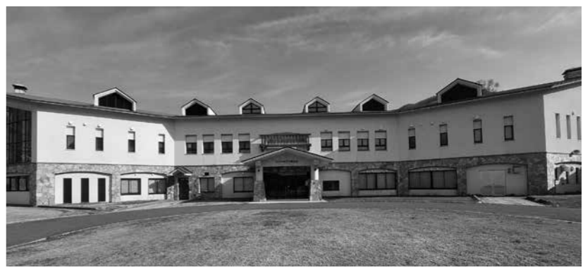
エバーランド奥大山

Q 要支援者が増加傾向にあるが、委託先の事業所は？ A ブランドオフィス(尚仁福祉会)、日野病院居宅介護支援事業所、伯耆中央病院居宅介護支援事業所、日翔会、ケアプランセンター孫の手の5か所に委託して実施しています。