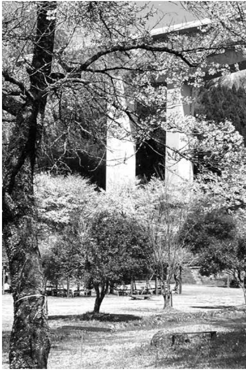
トイレの設置が決まったせせらぎ公園

①新規事業として、出かける役場が始まるが、「どんな困りごとでも助けに向かいます」という姿勢で事業展開するようだが、住民から喜ばれること、困ったかたをどうして助けるかを考えて、役場職員、ケアマネジャー、民生委員などで慎重に進められたい。 ②せせらぎ公園内の整備について、長年の要望だったトイレが設置される。主に利用される、グラウンドゴルフ愛好者の皆さんの意見を十分に取り入れていただきたい。また、体の