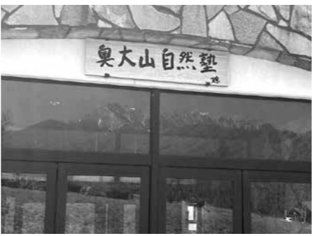
1000名の体験利用を目指す奥大山自然塾

不自由な方も使用できるように配慮されたい。 ③奥大山自然塾事業は開講以来600名の体験利用者があり、好評を得ている。来年度は、900名から1000名を目指しているようだが、室内の展示について、ジオラマはあるが、もっと感動を与える展示を設置してどうか。 ④町の消防団は、