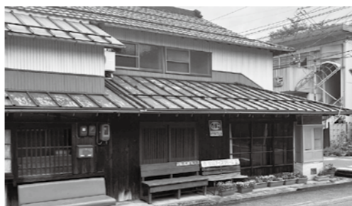
まちの本屋予定地(旧川上書店)

本場に単なる日常だけを考えると、未来の江府町があるかと考えたときにどうかと思う、私の考え方を一方的に押し付けるのではなく、そういった方の考え方も取り入れながら、せっかく始めた事業をいい形で進めていきたいと考えている。