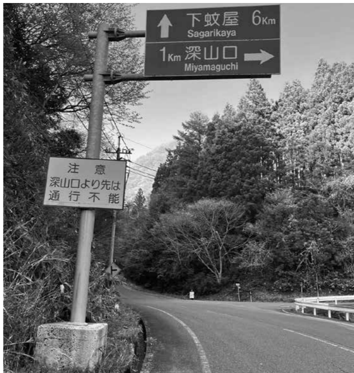
冬季は雪崩や落石の可能性もある広域農道

②市民農園管理事業において、農地は耕運しているが、市民農園としては、現在休止している。今後の利用方法、または廃止などを含め、検討されたい。 ③道路維持管理において、広域農道下蚊屋俣野線は午前7時以降に除雪しているようだが、この道路は落石や雪崩の危険があり、使用状況や、交通量などを考慮して冬季の閉鎖も検討されたい。