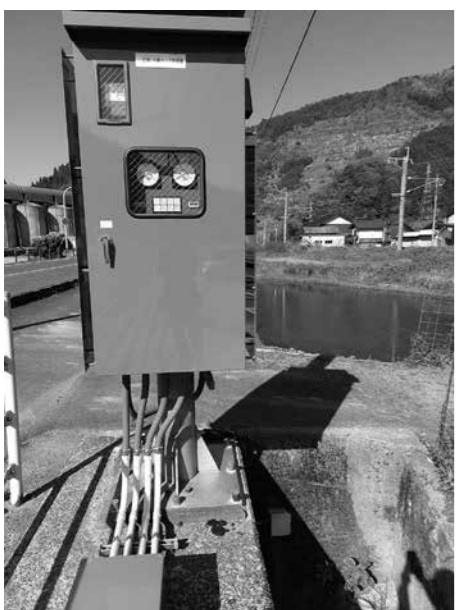
一旦第1中継ポンプ制御盤更新

奥大山自然塾を始め、木谷沢溪流の整備等、奥大山エリアの適正管理をする為、小型パワーショベルの借上や、大型除雪ハンドロータリーの購入をする。今後