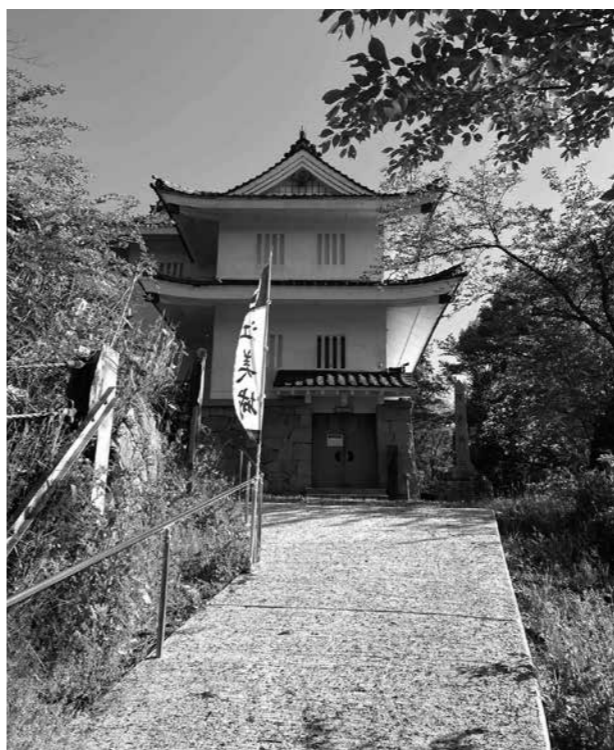
トイレの整備が待たれる民俗資料館

れるが、具体的な詳細は決まっていない。今後、洋式や和式を含め、学校や児童・生徒の意向を取りいれて実施されたい。 ③民俗資料館について、来場する方々の不満にトイレがないこと、いつも閉館しているということがある。閉館に関しては電話連絡により対応のことだが、トイレがないことは致命的と言える。トイレの整備について、検討されたい。