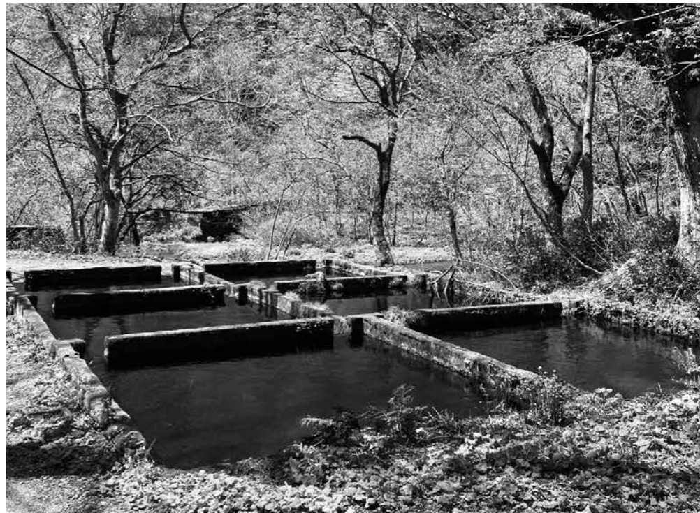
モリアオガエルやサンショウオが生息する木谷沢

Q 木谷沢にコンクリート柵があるがヤマメなどを養殖してはどうか？ A 柵や周辺にはモリアオガエルなど希少動物が生息しており難しいと思います。