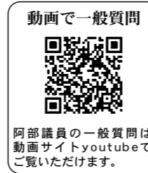
阿部議員の一般質問は動画サイトyoutubeでご覧いただけます。