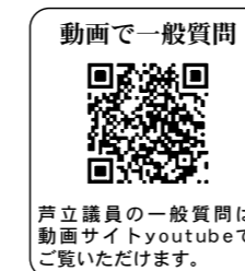
動画で一般質問 芦立議員の一般質問は動画サイトyoutubeでご覧いただけます。