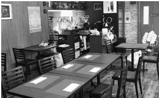
おしゃれな感じのビストロノブ