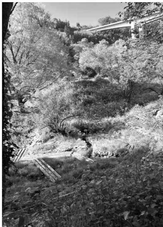
せせらぎ公園内の再生中のビオトープ

Q ふるさと納税7億円を予測しているが、今後の展開はどうか？ A 今までのやり方では天井が見えているかもしれない。今まで以上に情報発信に努めてまいります。 Q 企業版ふるさと納税に力を入れてはどうか？ A 環境や水を大切にする企業には進めたい。日本ヘルスケア協会を通じて個別具体的なあたり、企業版ふるさと納税に力を入れます。