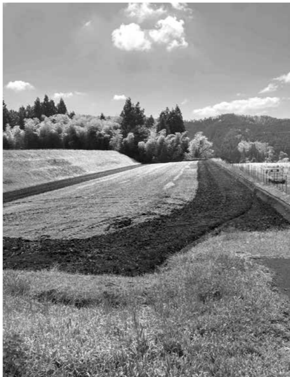
成功が期待される乾田直播