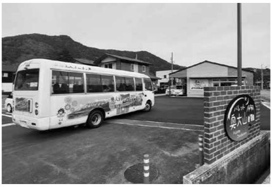
佐川第2団地バス停

Q 佐川第2団地の町外からの移住者数と、入居数の現状は？ A 令和6年3月で満室になりました。町外移住者数は、12名で、そのうち子どもは5名で、全12戸のうち町外からの入居数は、7戸です。