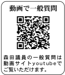
森田議員の一般質問は動画サイトyoutubeでご覧いただけます。