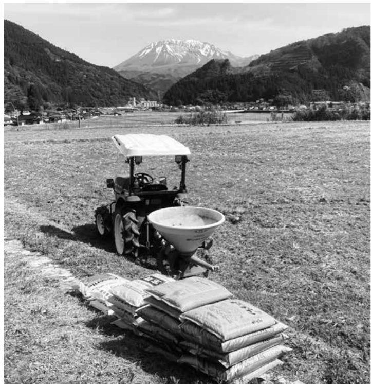
今年も始まった農作業

③保育園については、施設の老朽化や危険地域の環境など、早期の移転が望まれていたが、新年度に検討委員会を立ち上げる事となった。については、早期の移転と、希望の持てる保育園建設に向けて検討されたい。