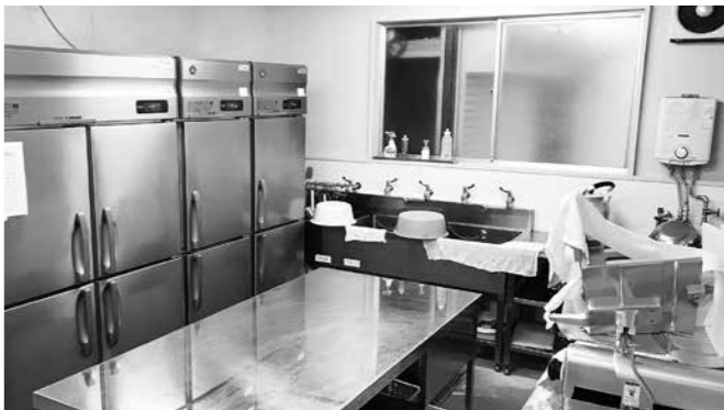
ジビエ解体処理施設：今後の加工技術習得にも期待

Q 町道橋の現状は？ A 順次、点検を行い、5年ごとに長寿命化計画の見直しを行います。