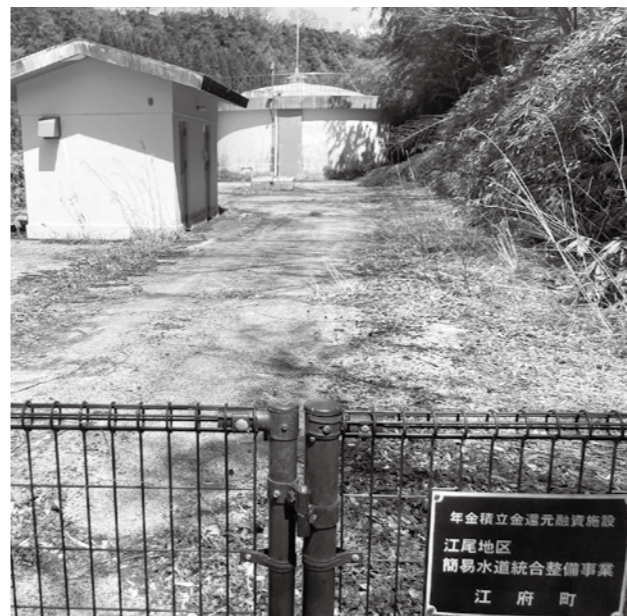
江尾地区の簡易水道