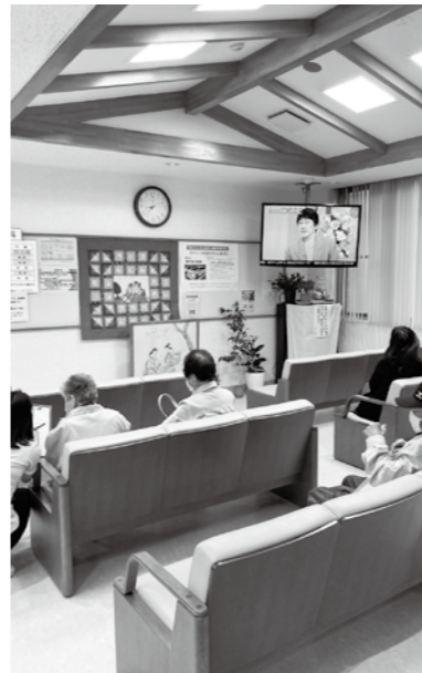
8時40分の診療所待合室