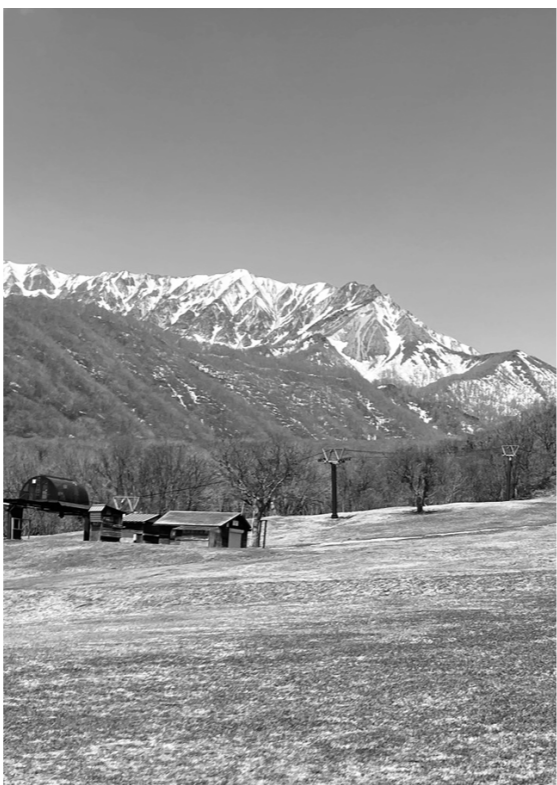
管理された奥大山ゲレンデ

Q 児童館・集会所の耐震調査をお願いしたい。 A 地元集会所所長や関係者と相談しながら実施します。 Q 文化財の保護・管理について環境整備も含め実施するべきでは？ A 早急に状況を確認します。