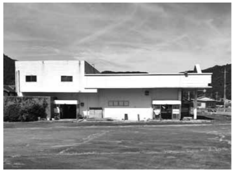
佐川地区移住促進住宅計画用地

Q 佐川の移住促進住宅の計画について？ A 今後、公募して事業者を決定し、事業を進めていきます。