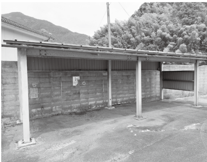
ミニライスカンター駐輪場