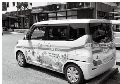
タクシーも町内一律同額で

公共交通機関は、当然必要なものと思っている。前回の公共交通会議を受けて、改善する点もいくつかある。いきなり他町のようにではなく、本町なりの考え方で進めていきたい。