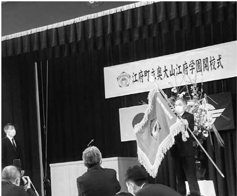
新しくなった校旗

①魅力あるまちづくりには、ふるさと教育は大切である。また、江府町に関心と魅力を感じさせる教育は、担い手育成の基本であり、本町において、ふるさと教育の充実が、最重要課題の一つと考える。さらに、ロシアのウクライナ侵攻により、今、世界的に人権の意識が高まっている。本町においても一人一人の人権が尊重される地域社会づくりを目指す。より一層の人権教育の向上に努められたい。