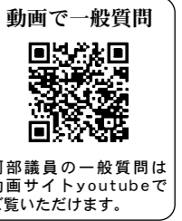
阿部議員の一般質問は動画サイトyoutubeでご覧いただけます。