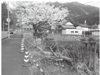
歩道脇で倒れた桜。運良く人身事故に至らず。