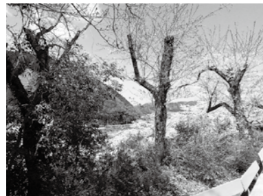
終末期の桜3本 左・中はほとんど花がついていない。