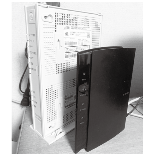
ホームゲートウェイと無線ルーター

質問 町内の光ファイバー網は、平成22年度に約6億円をかけて整備されているが、現状十分に利用されていないと考える。スマートフォンの普及を促すこと、情報伝達には光ファイバー網を有効利用することが先決ではないかと考える。今後の利用について考えを伺う。