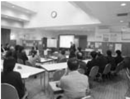
先生方による意見交換