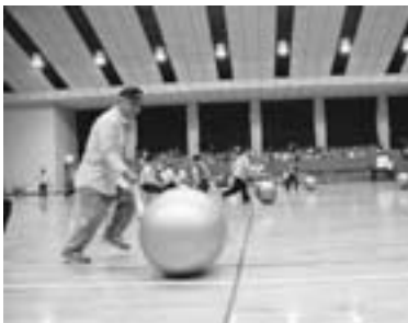
▲白熱する大玉ころがし