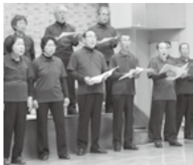
歴史あるアイリス合唱団