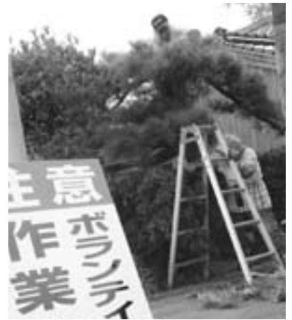
▲看板を見かけたら要チェック