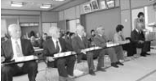
▲表彰を受ける歴代会長