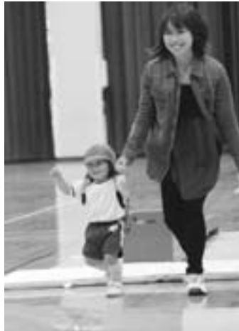
▲お母さんと一緒に嬉しいな