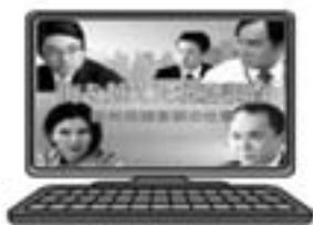
Web-TAX-TV 「海を越えた税務調査」

国税庁ホームページのインターネット番組「Web-TAX-TV」で、国税庁の取組を紹介する番組を配信しています。ぜひご覧ください。