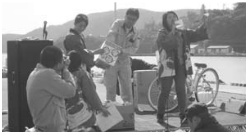
▲ドキドキの抽選会

特に江府町の新鮮野菜は大好評で、販売開始と同時に次々購入していただき、およそ15分ではほぼ完売となりました。その他の特産品もほぼ完売し、西ノ島町のみなさんに大変喜んでいただきました。 イベントの締めくくりには抽選会が行われ、江府町からも特産品を提供しました。見事当選されたみなさんの笑顔がとても印象に残りました。