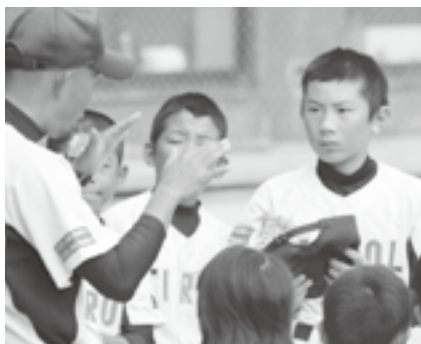
▲監督のアドバイスを真剣な表情で聞く選手

10月12日から行われた今大会。チロルジュニア江府は1回戦明道に5-0勝ち、2回戦は淀江に7-6でサヨナラ勝ち、3回戦は西伯郡の強豪会見に1-0で競り勝ち準決勝へコマを進めました。準決勝は名門車尾スポーツ少年団に2-1で延長8回にサヨナラ勝ち。そして決勝は初回から3点を先制するなど主導権を握り8-5と突き放して優勝しました。