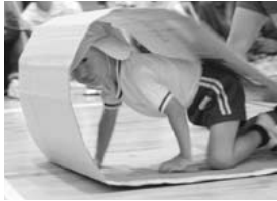
▲キャタピラーを上手に乗り越えます