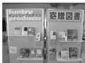
寄贈された図書(江府町立図書館) ▲

サントリープロダクツ(株) 天然水奥大山ブナの森工場 図書を寄贈 江府町制60周年に際し、10月23日、当町に水工場を有すサントリープロダクツ(株)から図書の寄贈がありました。サントリーの企業理念「人と自然に響きあう」に則し、水に関する図書だけでなく自然にかかわる図書を寄贈いただきました。寄贈された図書は早速、江府町立図書館の蔵書として活用。子ども達の豊かな情操を育む図書として利用していきます。