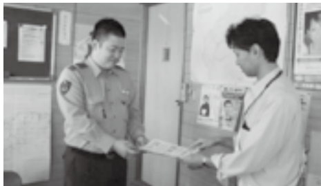
黒坂警察署江尾駐在所の駐在さん

9月26日に町内の接客を主とする事業所を22か所巡回し、「気付き」「つなげる」役目について啓発を行いました。