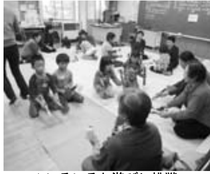
▲いろいろな遊びに挑戦

第1回は「昔の遊びを知ろう」ということで、銭太鼓・お手玉・おはじき・コマ回し・けん玉の5つの遊びを教えてくださいました。最初は苦労していた子ども達も、達人の皆さんにやさしく教えていただき、みるみる上達することができました。