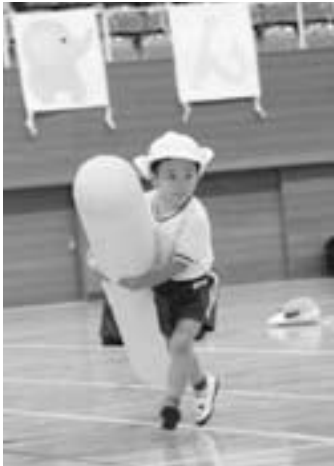
▲体より大きなバトンリレー

10月5日、江府町総合体育館でこどもの国保育園の運動会が行われ、園児や保護者、地域の方々で賑いました。あいにくの天気で屋内での開催となりましたが、園児はこの日のために練習を重ねた競技やかわいらしいダンスを披露。会場からは大きな拍手と歓声が沸きました。一生懸命な子ども達の姿に癒される、終始笑顔の運動会となりました。