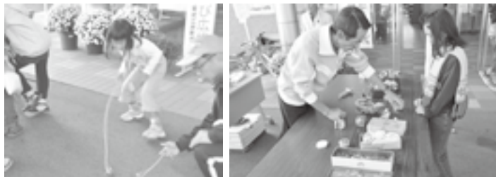
コマ回し、ヨーヨーのやり方を楽しく教わっていました。