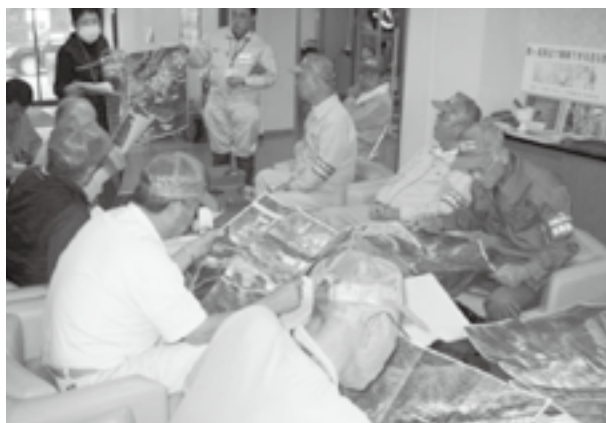
調査する農地を図面で入念に確認