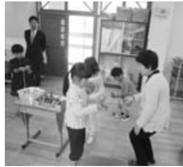
▲技に磨きをかけます

2日間でのべ19名の達人に教えてもらった子ども達は、16日に開かれる学習発表会でその成果を披露すること。発表会が楽しみです。