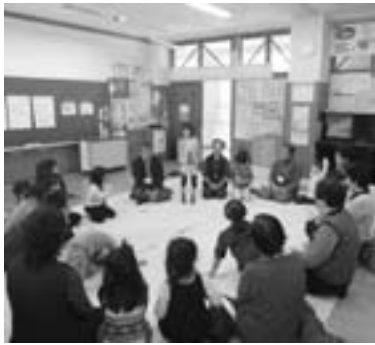
▲みんなで感想発表タイム

2日間でのべ19名の達人に教えてもらった子ども達は、16日に開かれる学習発表会でその成果を披露すること。発表会が楽しみです。