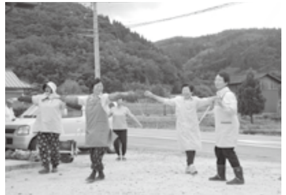
▲必ず全員でラジオ体操をしてから作業を行う