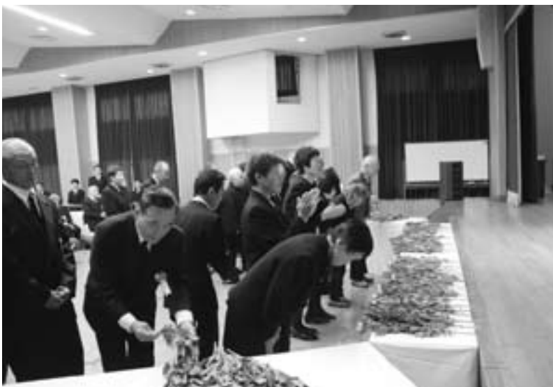
▲参列者による献花

当日は、遺族をはじめ70名の方々が参列し、303柱のみたまの前で黙とうをささげ、白と黄色の菊の花を手向けました。