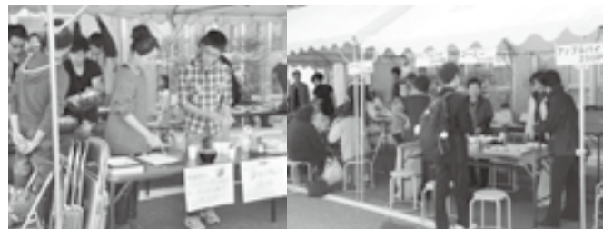
お昼時は多くの人で賑わっていました。