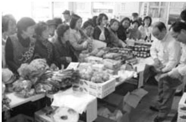
▲お客さんであふれかえる市

台風の接近により一時は開催が危ぶまれましたが、当日は晴天に恵まれ多くの来場者でにぎわいました。江府町から大根・白ねぎ・トマトなどの新鮮野菜や味噌・ブルーベリージャム・トマトケチャップなどの加工品にお米を持っていき販売しました。