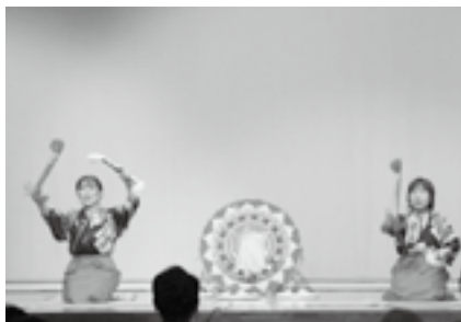
グループふく笑による銭太鼓