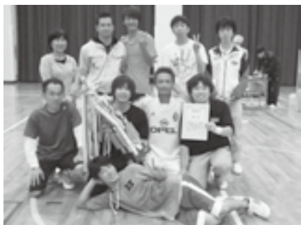
▲優勝した「KRCが連覇しにきました。」チームのみなさん

優勝 KRCが連覇しにきました。 準優勝 江府中A チーム 第3位 商工会 チーム