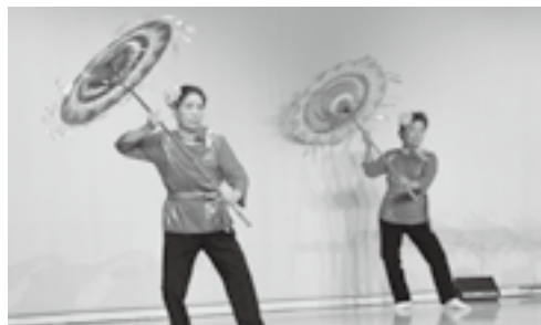
我楽会による傘踊り

保育園、小・中学校、各公民館講座、一般等の多くの方が日頃の成果を発表されました。