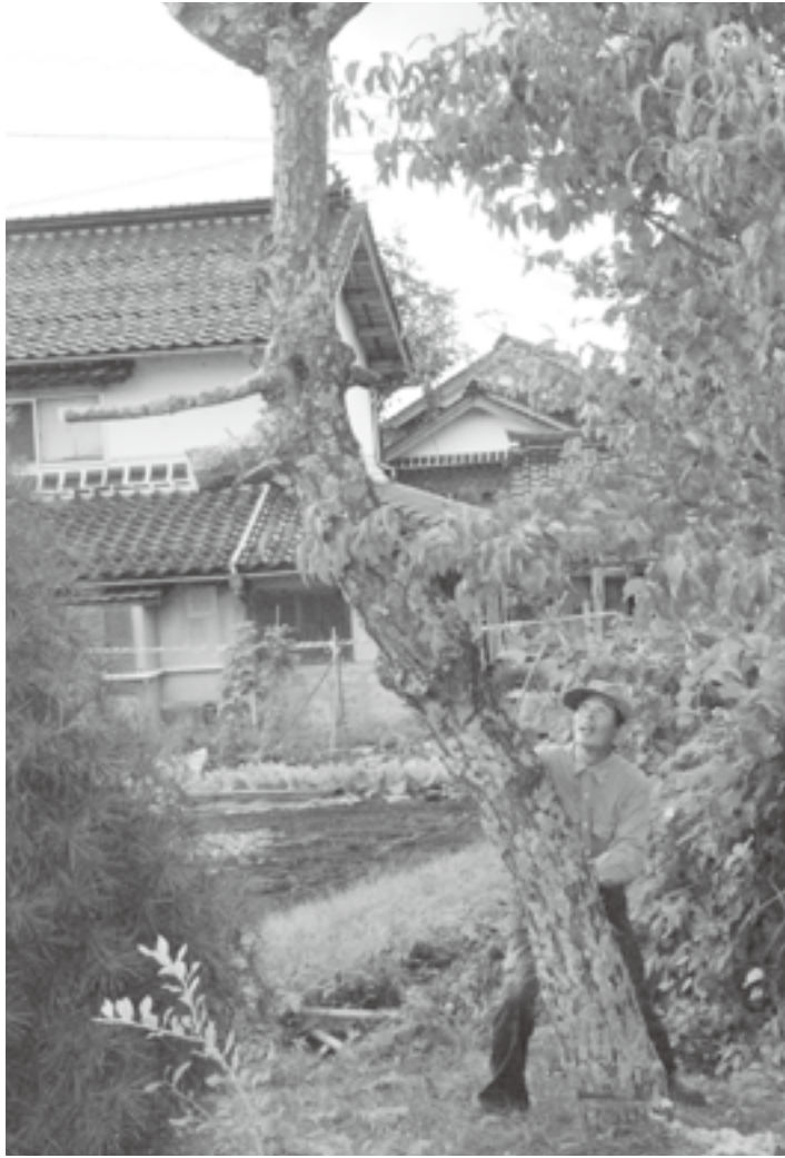
▲巨大な松の木伐採もお手の物

現在、町の高齢化率は4割を超え、少子高齢化に伴う地域の活力低下が大きな問題になっています。しかし、江府町にはそんな現状に対し『何とかしたい』と自らの意志で立ち上がり行動するグループが多数存在します。今回はその中から、宮市集落の『トンカチ屋さん』を取材し、活動の秘訣についてお話を伺いました。