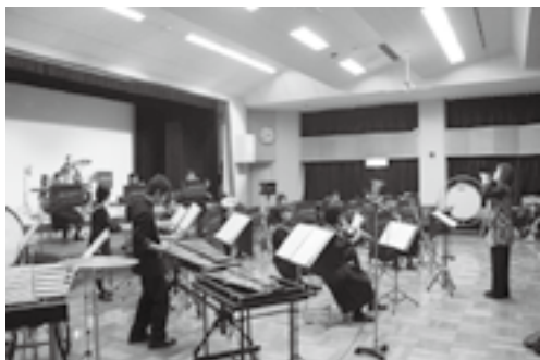
江府中学校の圧巻の演奏