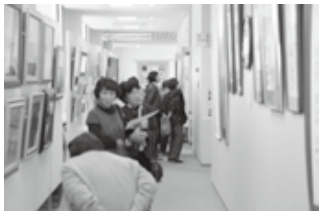
展示されている作品は力作ぞろい