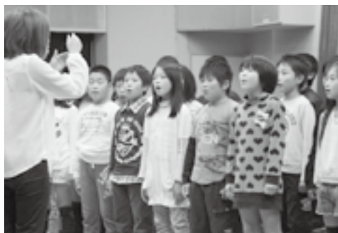
江府小学校による合唱