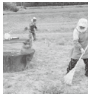
▲秋祭りの会場となる広場の草刈り中。とにかく女性がとても元気です。

トンカチ屋さんの構成メンバーは65歳から80歳と幅広く、平均年齢はなんと70代。しかし、20代にも勝る行動力で、日々地域の困りごとを解決し続けています。