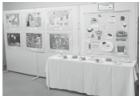
保育園児の素敵な作品もズラリ！