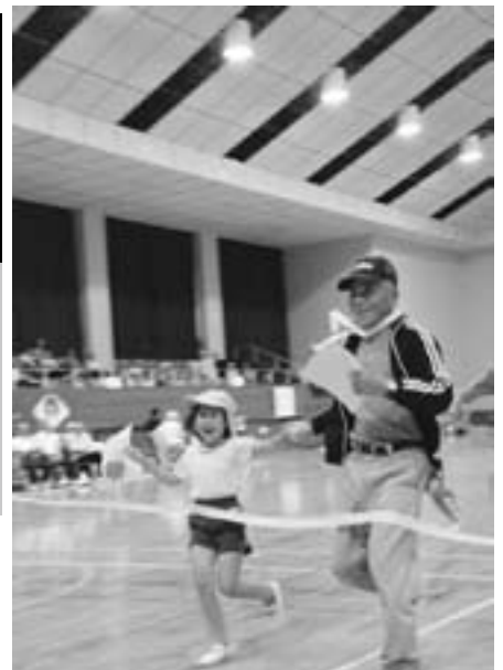
▲園児との合同種目「ともだちみつけた」

10月11日、江府町総合運動公園体育館で第34回高齢者スポーツ大会が行われ、各地区から約300人の参加者で賑いました。まずは参加者全員でラジオ体操を行ってから競技スタート。ボーリング競争や玉入れ競争、ボール送り競争など熱戦が繰り広げられました。閉会式で佐々木副会長は「とても楽しい雰囲気できました。明日からの生活にも運動を取り入れ、来年も元気な姿でお会いしましょう。」と話しました。