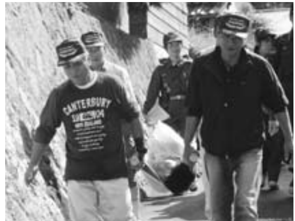
▲簡易担架を使った救助訓練

ついて集落で話し合いを行っていることもあり、素早い対応でスムーズな訓練となりました。