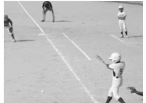
▲数々の強豪を破つての優勝

10月19日、米子市淀江球場で行われた第35回西部地区少年野球大会決勝で、チロルジュニア江府が啓成（けいじょう）スポーツ少年団を降し、悲願の初優勝を遂げました。