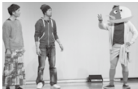
江府町青年団によるコント