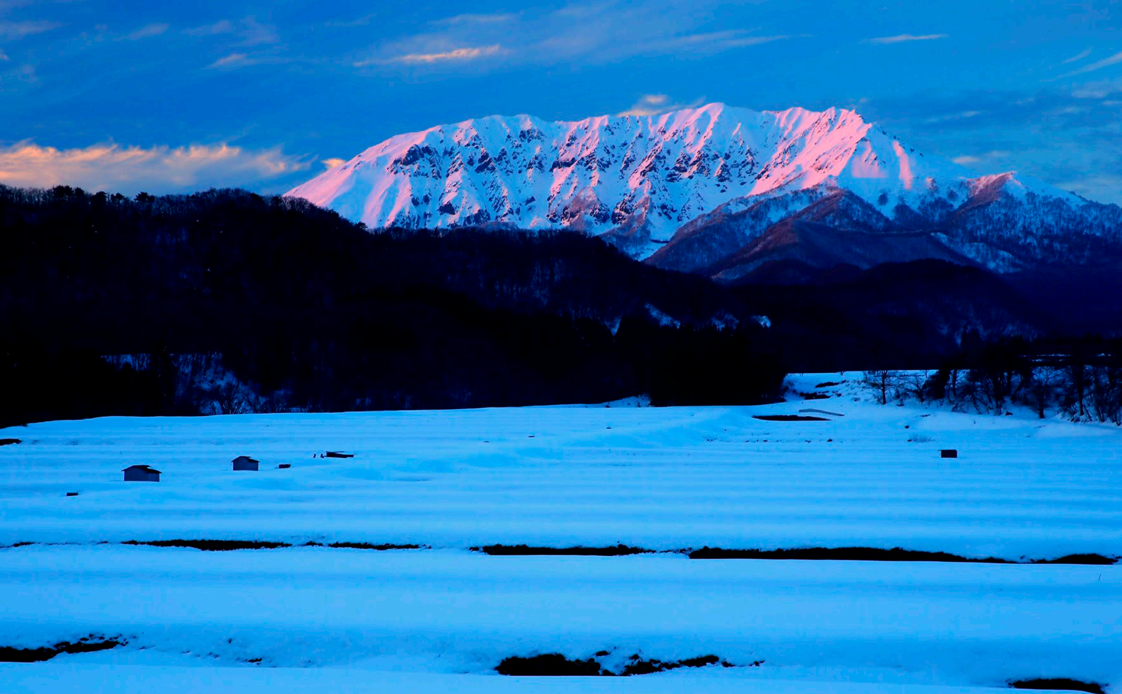
御机地区から眺める紅大山