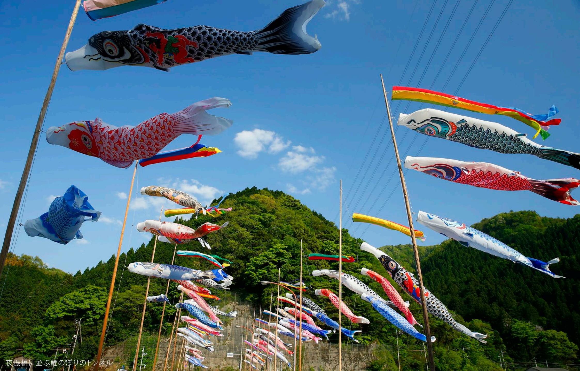
夜振橋に並ぶ鯉のぼりのトンネル