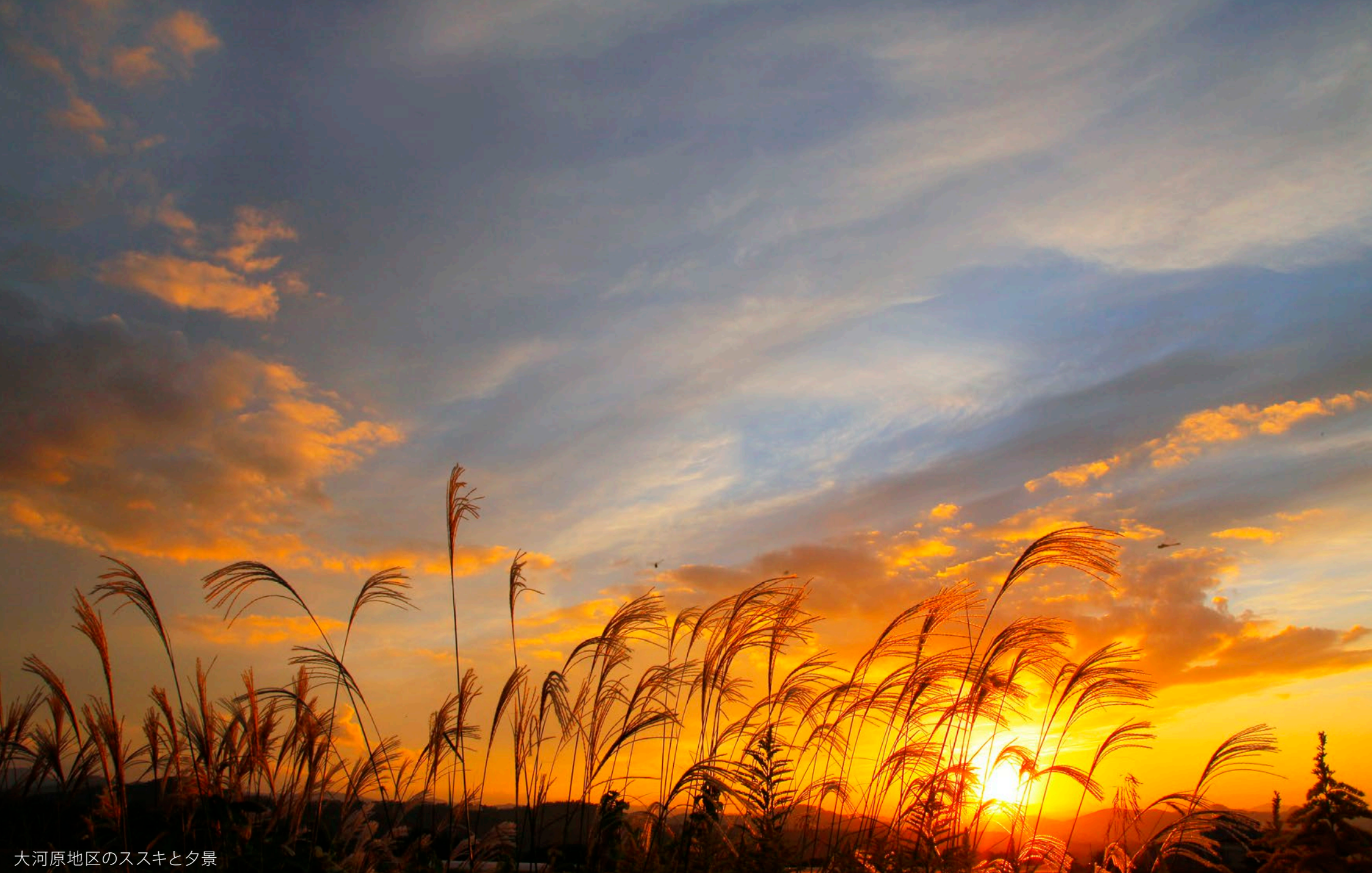
大河原地区のススキと夕景