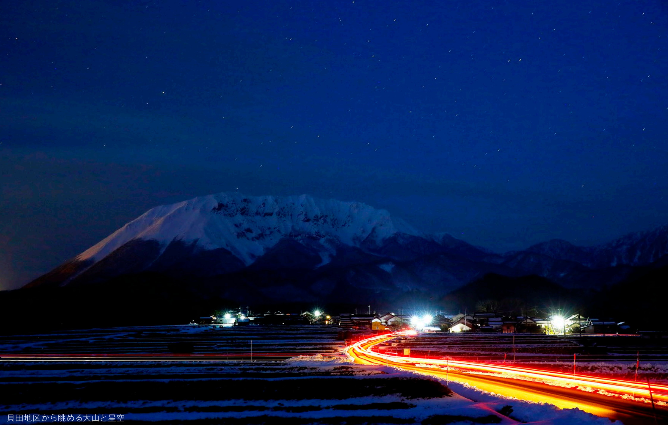
貝田地区から眺める大山と星空