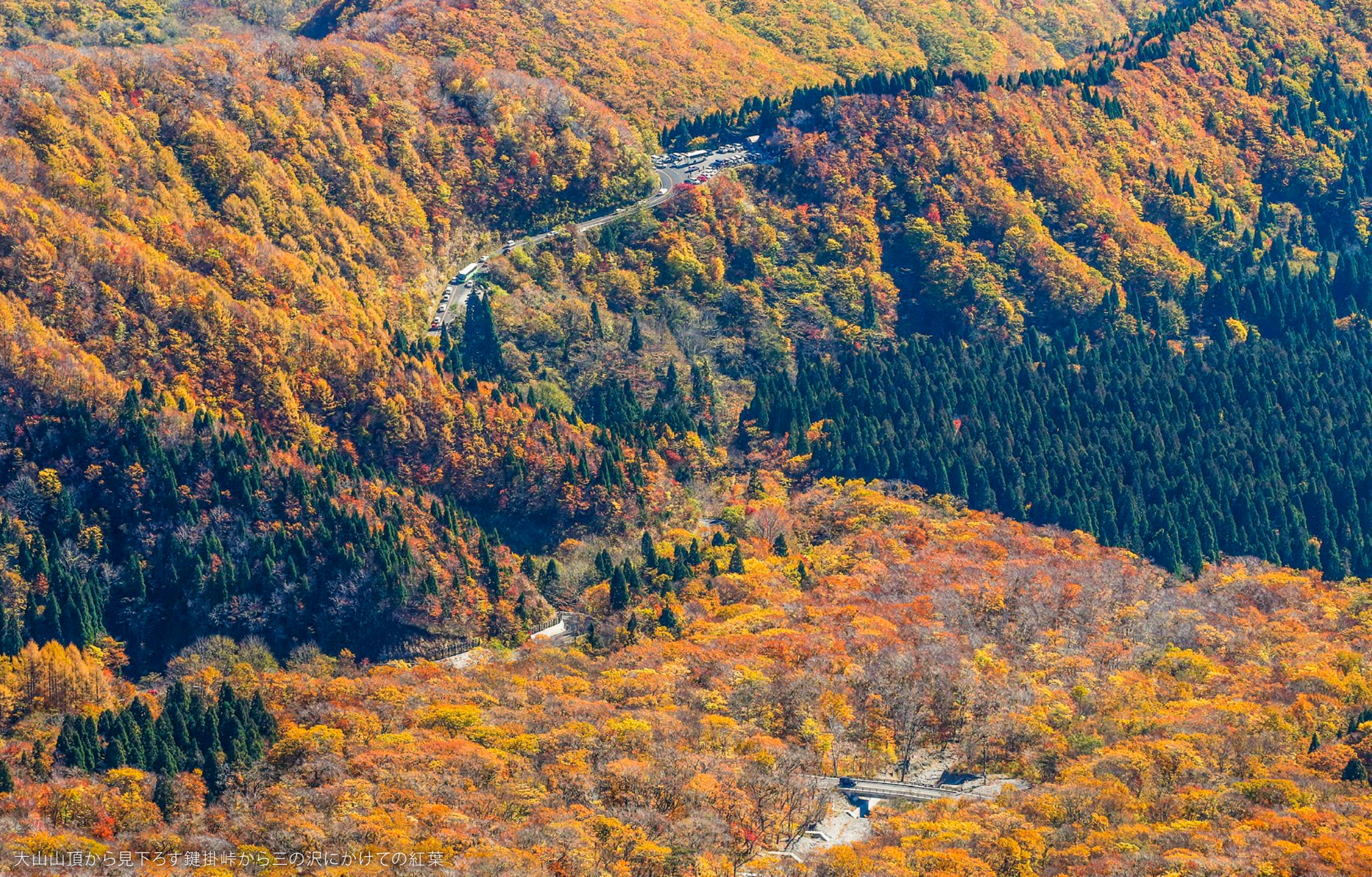
大山山頂から見下ろす鍵掛峠から三の沢にかけての紅葉