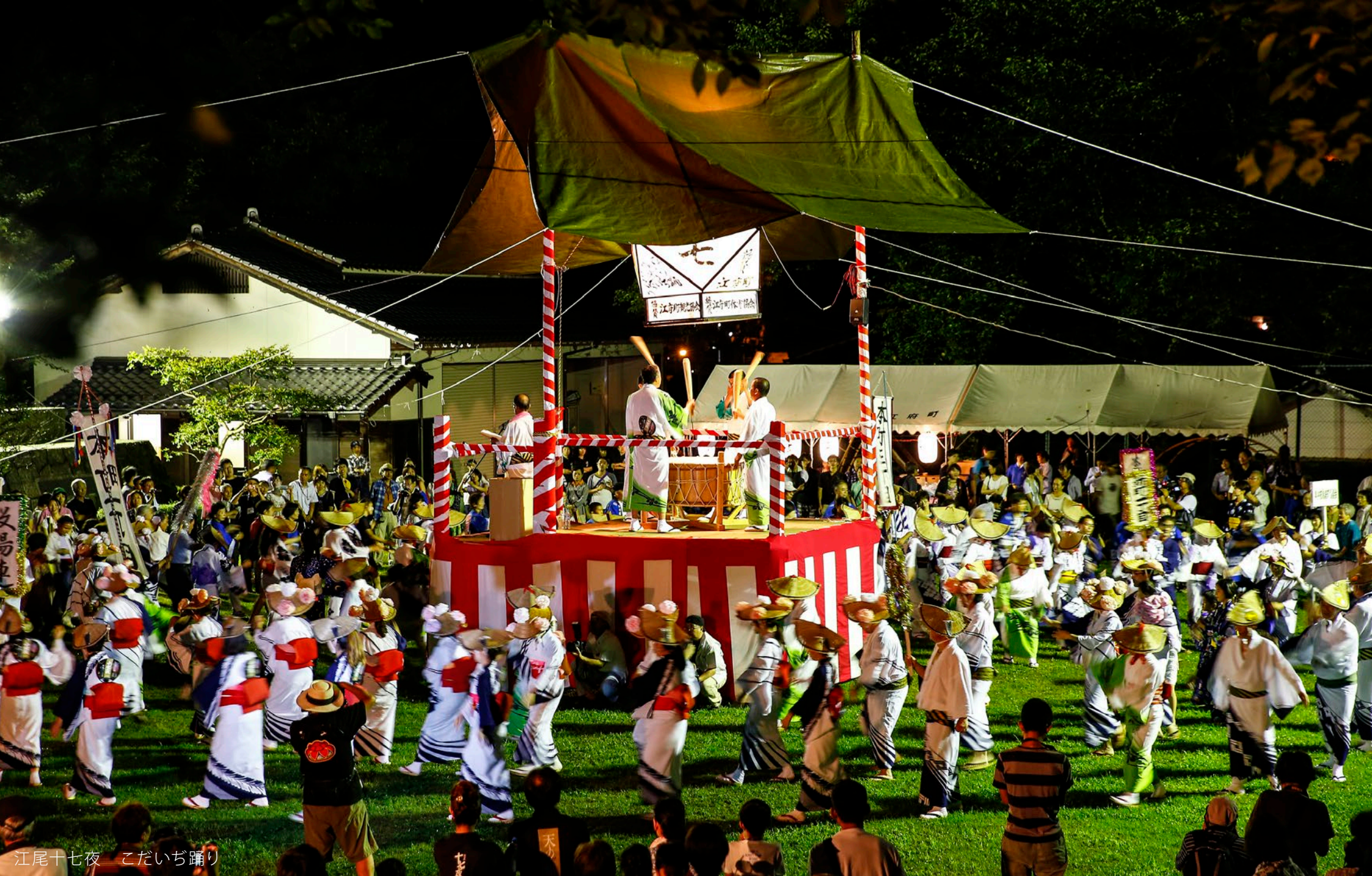
江尾十七夜 こだいぢ踊り