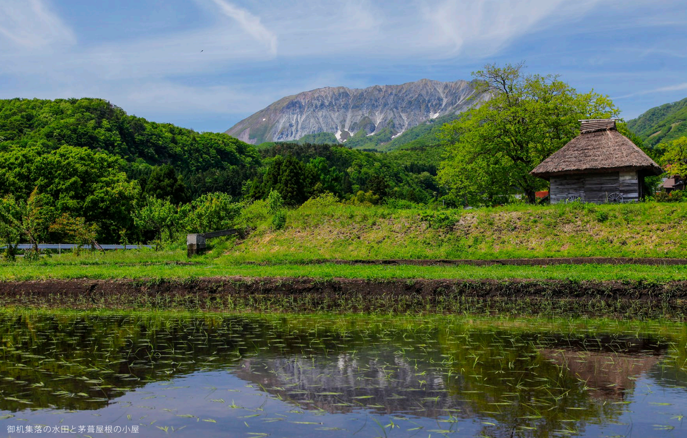
御机集落の水田と茅葺屋根の小屋