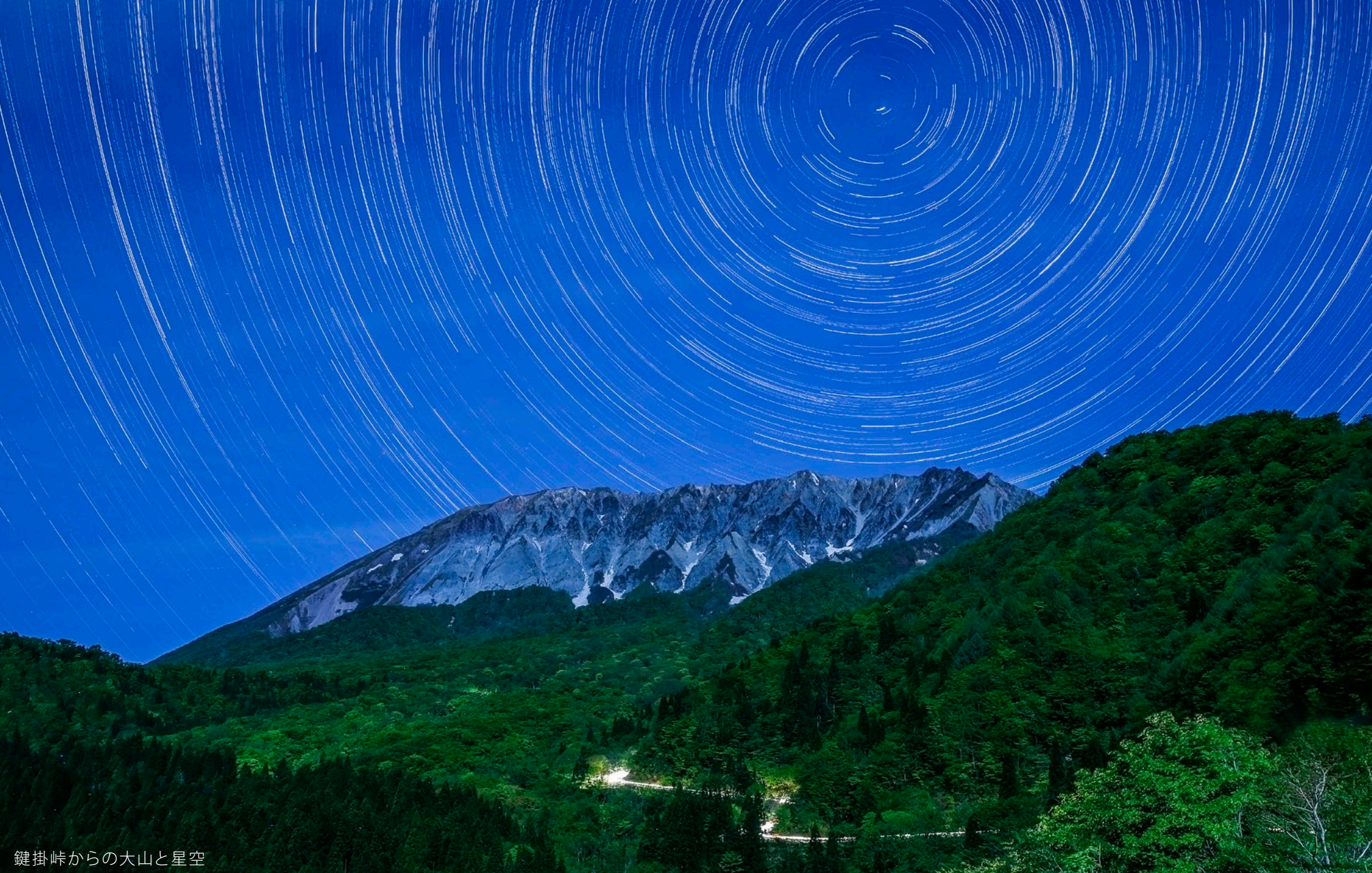
鍵掛峠からの大山と星空