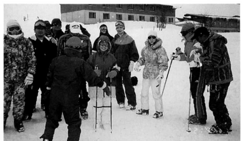
▲みんなの応援ですぐにスキーが上達しました

二月十九日から三日間、鏡ヶ成スキー場で神戸市障害者スポーツ協会主催のスキー教室が開催され十五名の方が受講されました。本町からもスキー学校の指導員を派遣してお手伝いしました。 参加者の中には、全くスキー経験のない五十八歳の全盲の女性もおられました。最終日には見事に自力滑走され、コーチたちを感激させていました。帰神後神戸市長から心のこもった礼状が届き、江府町と神戸市の交流の輪がいつそう広がったスキー教室でした。