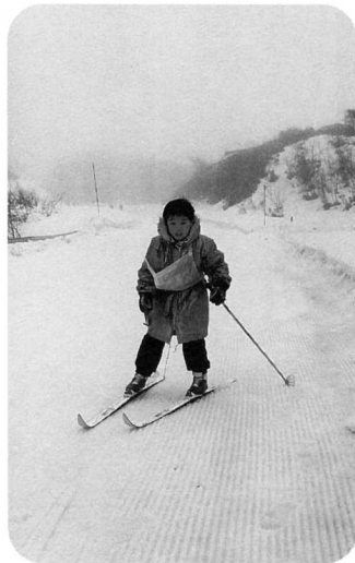
▲ガンバレチビッコ スキーヤー