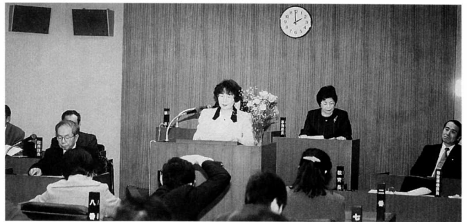
▲質問する一日女性議員

訓練は、美用地区都市農村交流施設付近から出火したとの想定でスタート。まず、自衛消防隊が機敏に初期消火にあたり、続いて町消防団そして江府消防署が到着し、連携プレーを図りながら消火にあたりました。