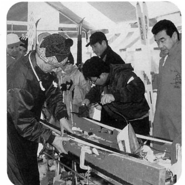
▲雪質に合わせ懸命のワックスがけ作業