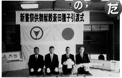
▲おごそかに行われた種子引渡式

一時間半ほどで出来上がり、試食した参加者は、思わぬ出来ばえ「おいしい」を連発していました。