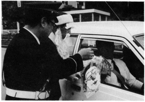
安全運転者へサンタからクリスマスプレゼント